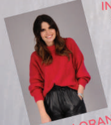
LUCILLE LORAND INFLUENCEUSE